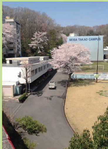
春の星槎高尾キャンパス (3号館からの眺め)

◎終演後2号館エントランスホールにて、お茶をご用意いたします。お気軽にお立ち寄りください。